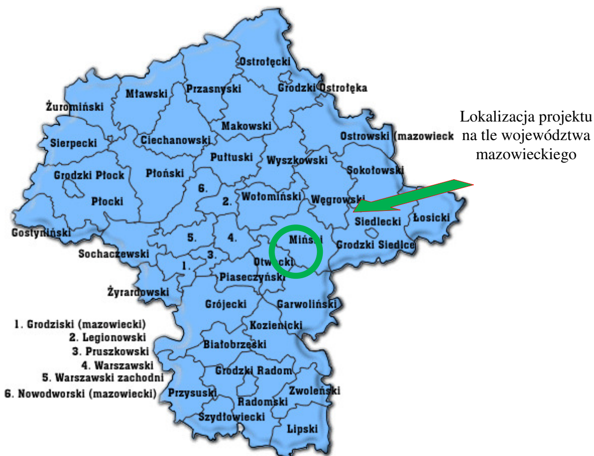
Mapa 1. Usytuowanie Gminy Siennica na tle województwa mazowieckiego

Grzebowilk jest wsią położoną w województwie mazowieckim, w powiecie mińskim, w gminie Siennica. W latach 1975-1998 wieś należała do województwa siedleckiego. Znajduje się w niej szkoła, kościół, biblioteka publiczna, dwa sklepy oraz budynek OSP. Grzebowilk jest jednym z 41 sołectw gminy Siennica.