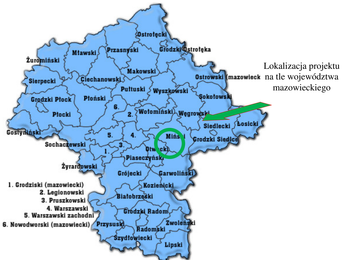
Mapa 1. Usytuowanie Gminy Siennica na tle województwa mazowieckiego

Grzebowilk jest wsią położoną w województwie mazowieckim, w powiecie mińskim, w gminie Siennica. W latach 1975-1998 wieś należała do województwa siedleckiego. Znajduje się w niej szkoła, kościół, biblioteka publiczna, dwa sklepy oraz budynek OSP. Grzebowilk jest jednym z 41 sołectw gminy Siennica.